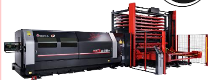
VENTIS 3015 AJ