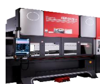
EGB 6020 ATC