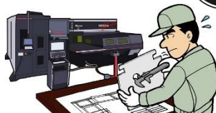
ACIES AJ SERIES